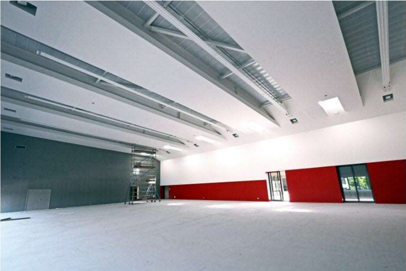
16 / 20