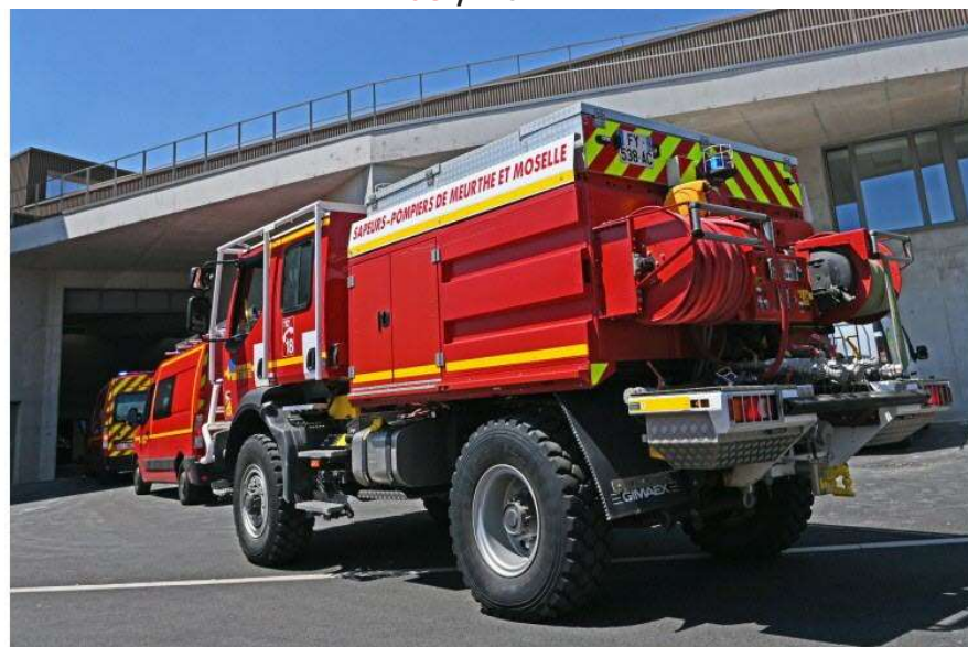
04 / 20