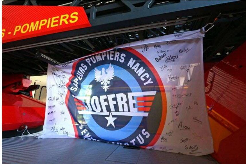
03 / 20