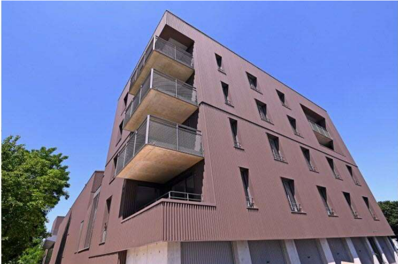
13 / 20