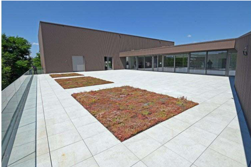
14 / 20