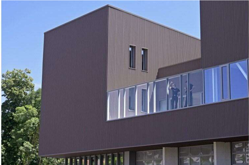
17 / 20