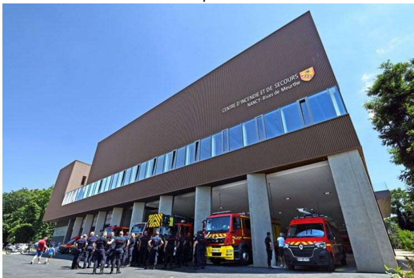
05 / 20