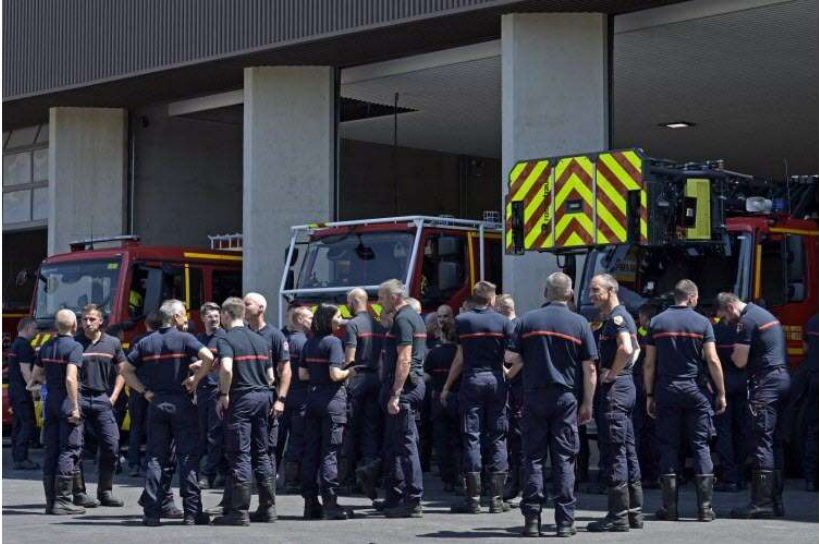
07 / 20