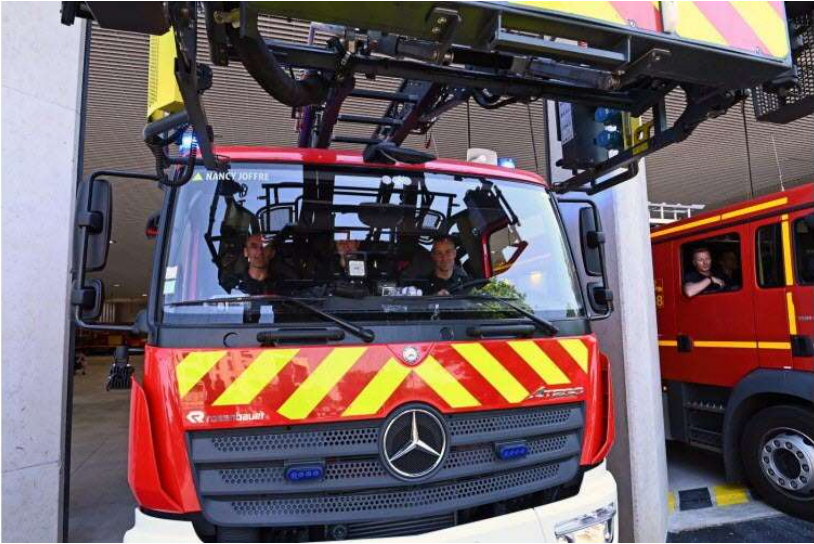
06 / 20