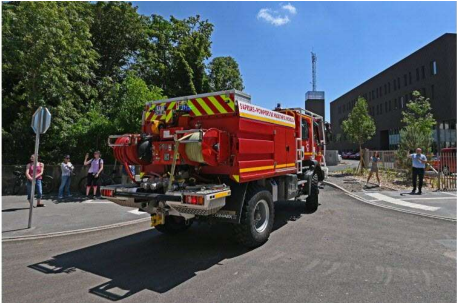
08 / 20