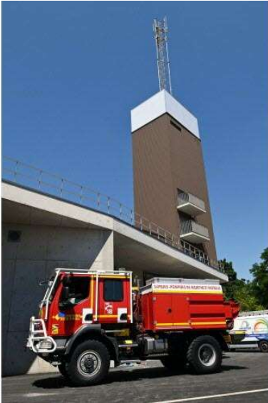
15 / 20