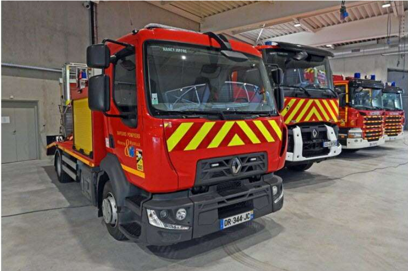
12 / 20